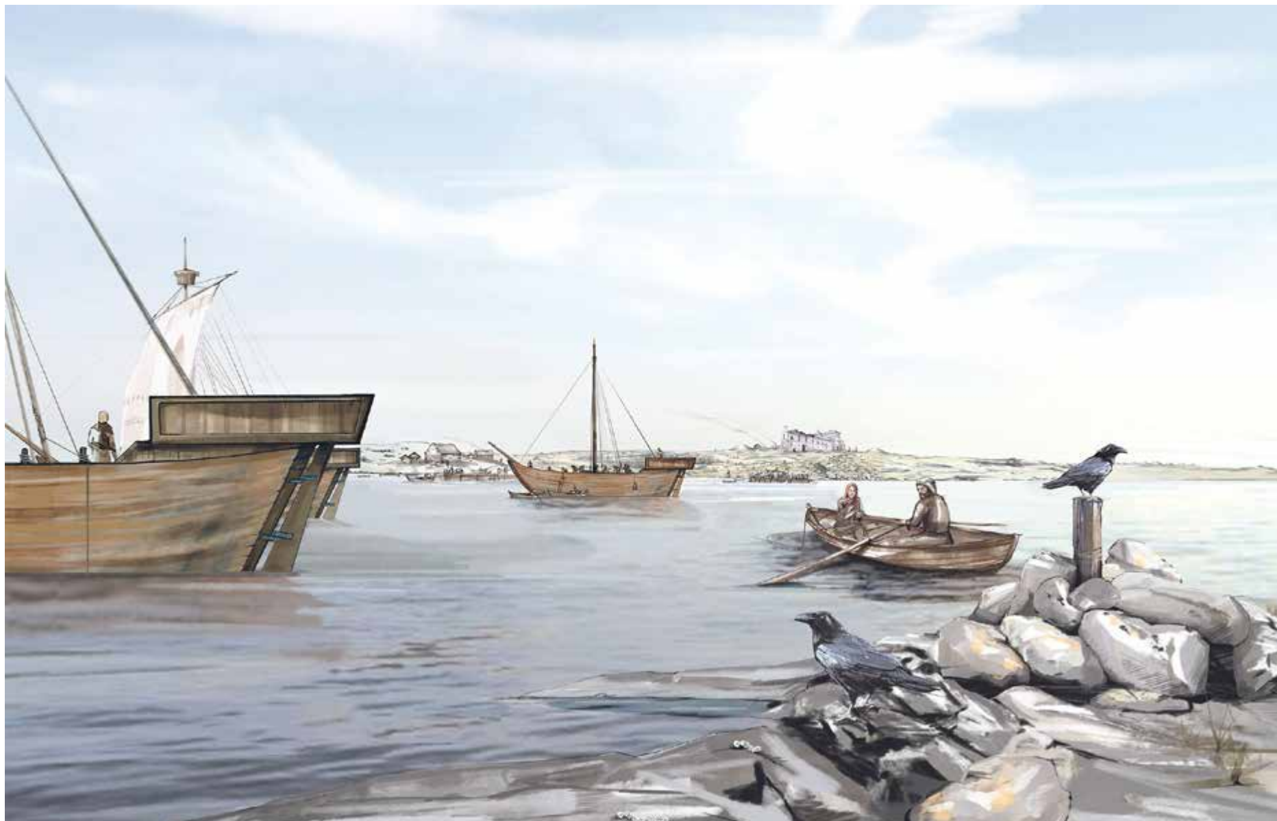
Slik kan Avaldsnes havn ha sett ut under sin storhetstid.